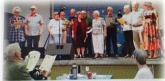
AT BEVARE OG FORNY. Det er formålet for Visens Venner på Amagerland, som just nu sætter deres 33. sæson i gang. Visens Venner på Amagerland er en lokalafdeling af Visens Venner i Danmark, hvis formål er at bevare og forny den danske visetradition. Arrangementerne foregår en gang om måneden fra september til marts og afholdes i festsalen på Karvevejens Skole. Forsiden den skønne salverende kerne herude Visens Venner på Amagerland også af et træfjeld og tilsvarende publikum. Visens Vennerne er hyggeligt samvær, man spiller sangene og nyder samtidig skønne varer fra den dygtige pianist efterfulgt af underholdende optræden og fællessang. Hvad bliver der for musikken og der er plads til flere, som vil være aktive, end

Der har også været annoncer i 2770 Kastrup og Ørestad avis, dog lidt beskåret.